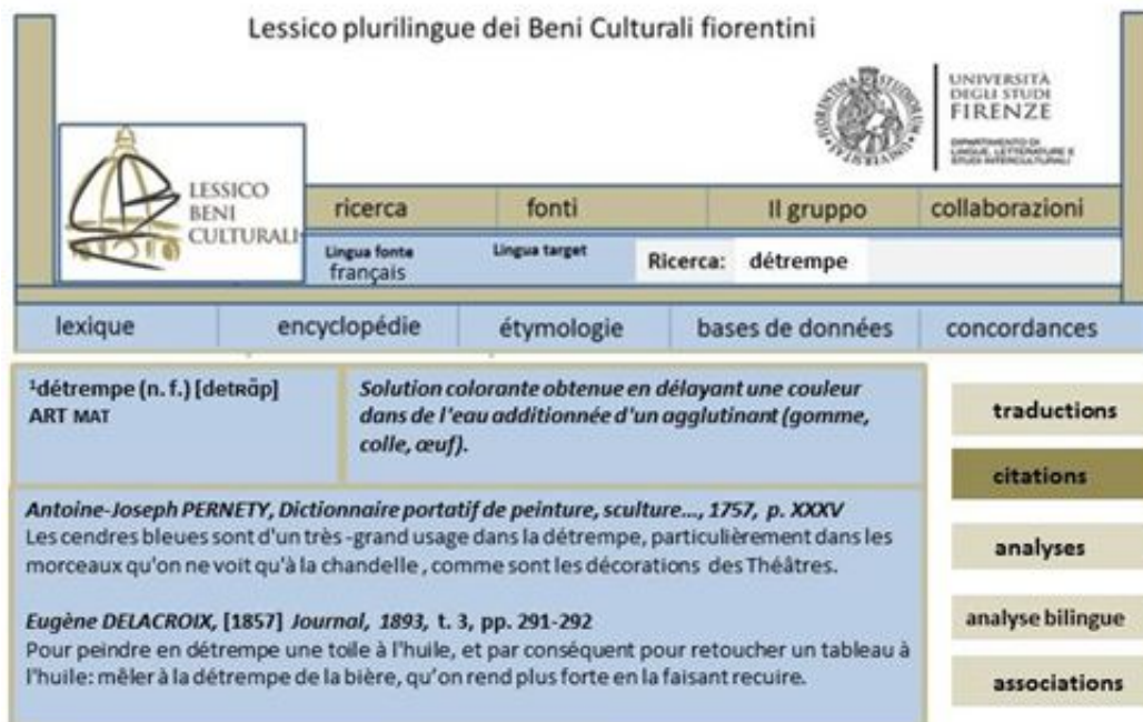
Image 2 : article monolingue français « 1. détrempe », informations de bases et citations

Nous proposons cependant aussi des informations facultatives, qui sont de différents types selon les langues (par exemple dans la catégorie « analyses » peuvent apparaître tant des informations étymologiques qu'encyclopédiques ou historiques) et/ou selon les types de mots ou syntagmes décrits.